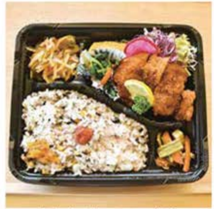
「しあわせ♪ヘルシー弁当」

最後に、「安芸まるごと丼」。安芸市の特産品「土佐ジロー」や「ちりめんじゃこ」「茄子」などをたっぷり使用