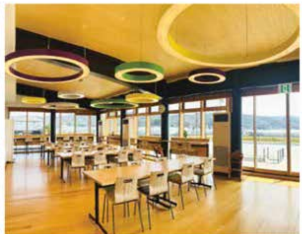
開放感あふれる店内