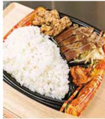
「くらえ！がつつり弁当」