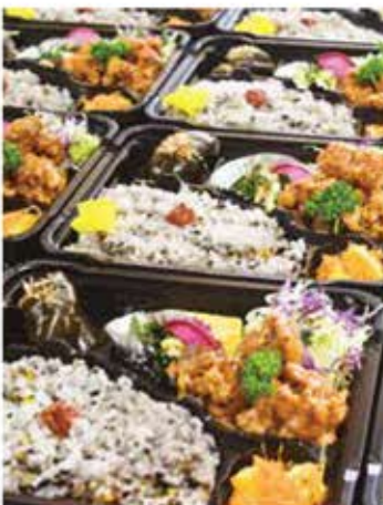
彩り豊かなお弁当の詰め作業