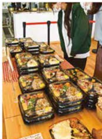
白米と十五穀米で悩むお客様